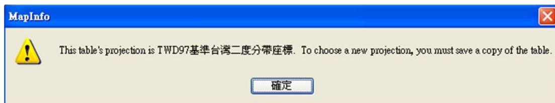
圖 2.7.3 說明本檔案所使用的座標系統