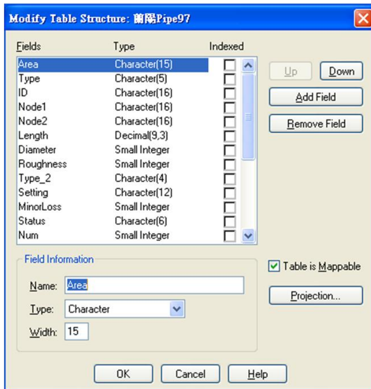
圖 2.7.2 選取對話框中的【Projection】選項